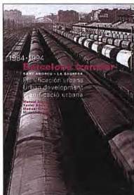
Actar. Barcelona 1995 24,5 x 33 cm. 160 páginas